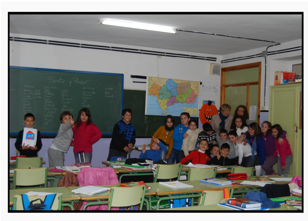
(Alumnado y profesoras del grupo clase de 3º CEIP El Sauce de Chauchina)

Concurso de Ideas: Todos los grupos de primaria de los centros educativos en los que se imparte el Taller de Sentir y Pensar