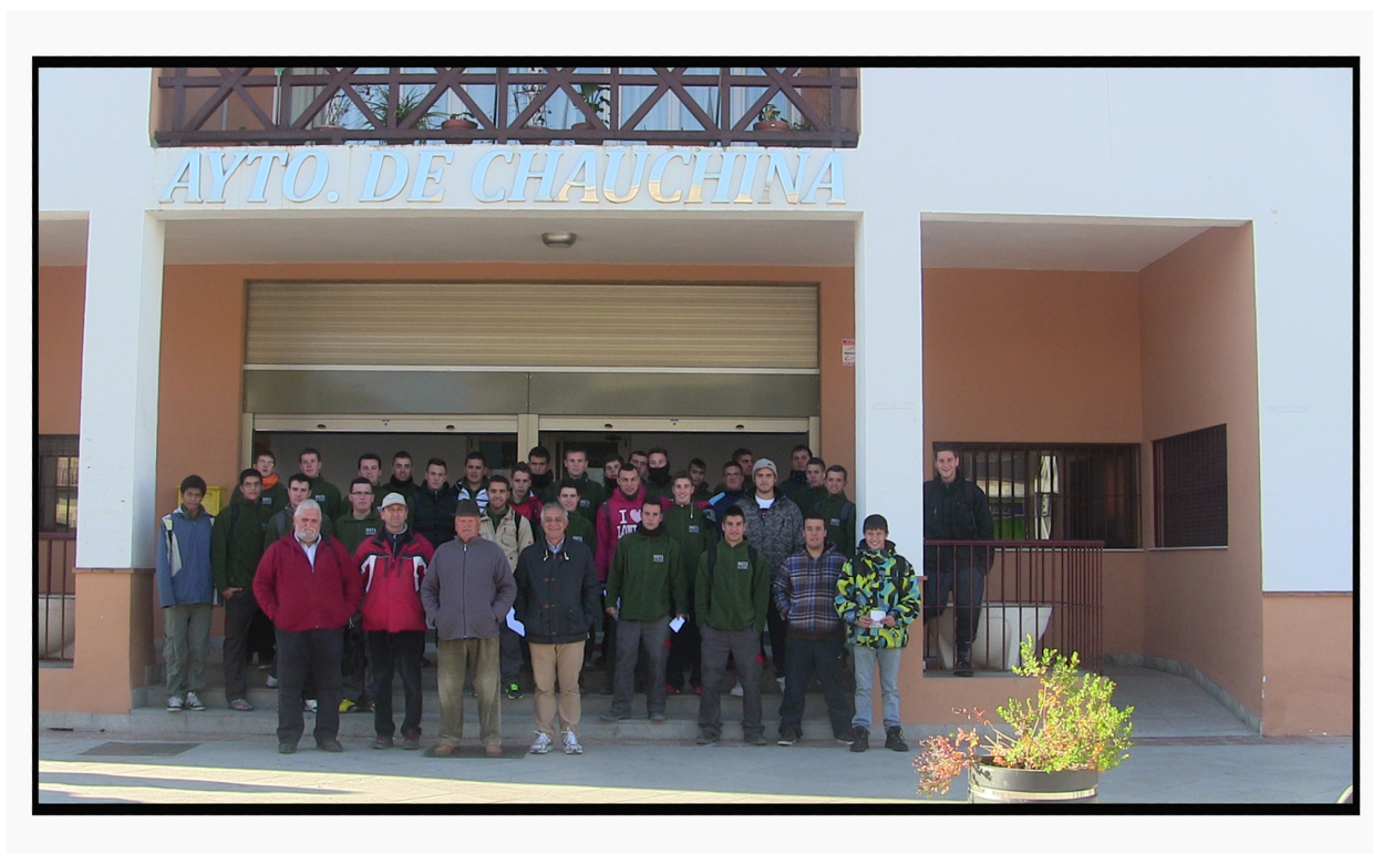
(Alumnado de la Escuela de Formación Agraria "El Soto")

Concurso de Ideas: Todos los grupos del Centro