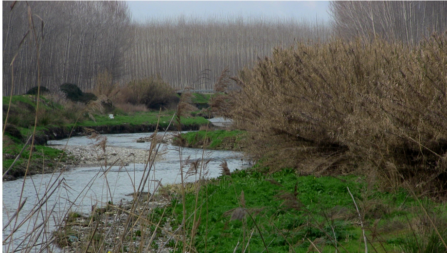
(Rio Genil a su paso por Chauchina y Fuente Vaqueros)

cercanas, la erosión del tiempo, los tipos de rocas por las que pasa... Hoy día, además, se ha sumado el factor humano. Algunos de sus afluentes son el Cubilla y el Colomera.