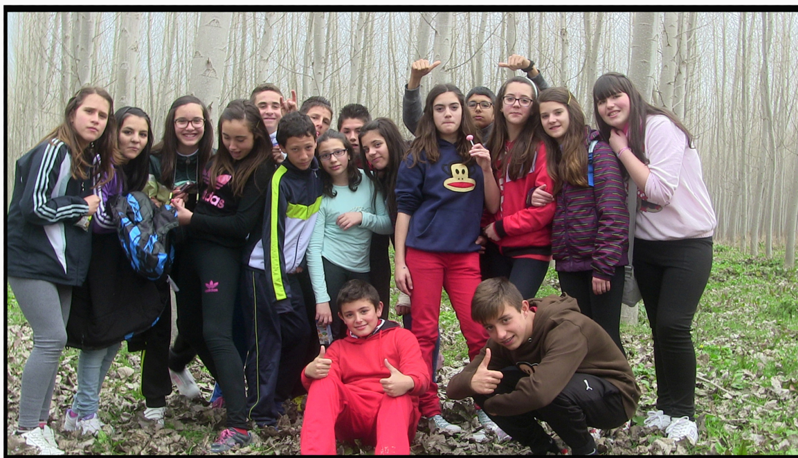
Grupo Clase 1º ESO IES Arjé de Chauchina

Concurso de Ideas: Todos los grupos de secundaria