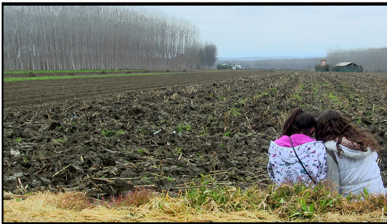
(La Vega Baja de Chauchina)

La Vega de Granada se ha dedicado tradicionalmente a la agricultura, aprovechando sus buenas condiciones de agua y suelo para cultivar, aunque tiene un importante sector turístico con hoteles, casas rurales y restaurantes.