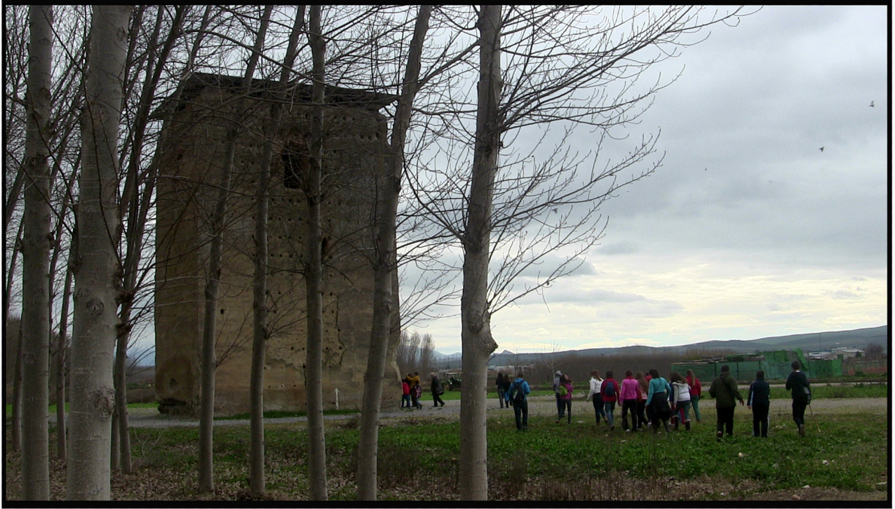
(Torre de Roma de origen Nazari)