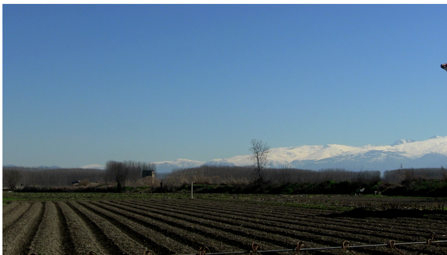
(La Vega y Sierra Nevada al fondo)

El clima es esencialmente mediterráneo continental en toda la vega, los veranos son calurosos y los inviernos muy fríos. Las precipitaciones son escasas, más acentuadas en invierno y primavera, con sequías que pueden durar 4 y 5 meses.