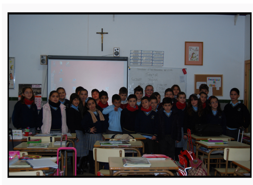
(Alumnado de 4º de primaria Colegio Diocesano Virgen del Espino de Chauchina)