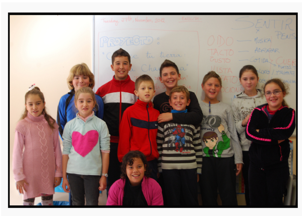
(Alumnado Colegio Rural Fuente la Reina de Romilla)